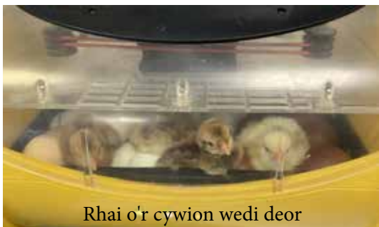
Rhai o'r cywion wedi deor

Yn dilyn ein thema mae'r disgyblion wedi bod yn ffodus i ddysgu am sut mae deorydd yn helpu sicrhau bydd wyau ffrwythlon ieir yn deori. Ar ôl i'r wyau fod yn y deorydd am dair wythnos cafodd y disgyblion oll y cyfle i weld sut roedd y cywion wedi tyfu yn yr wyau gan ddefnyddio golau gwres. Yn ystod wythnos olaf y tymor roedd llawer o gynnwrf a chyffro yn yr ysgol wrth i ni weld yr wyau yn deori. Cafodd y disgyblion gyfle i weld a dal y cywion bach cyn iddynt fynd i'w cartref newydd dros wyliau'r Pasg. Diolch i un o'n rhieni am alluogi ni i roi'r cyfle a'r profiad newydd yma i'n disgyblion.