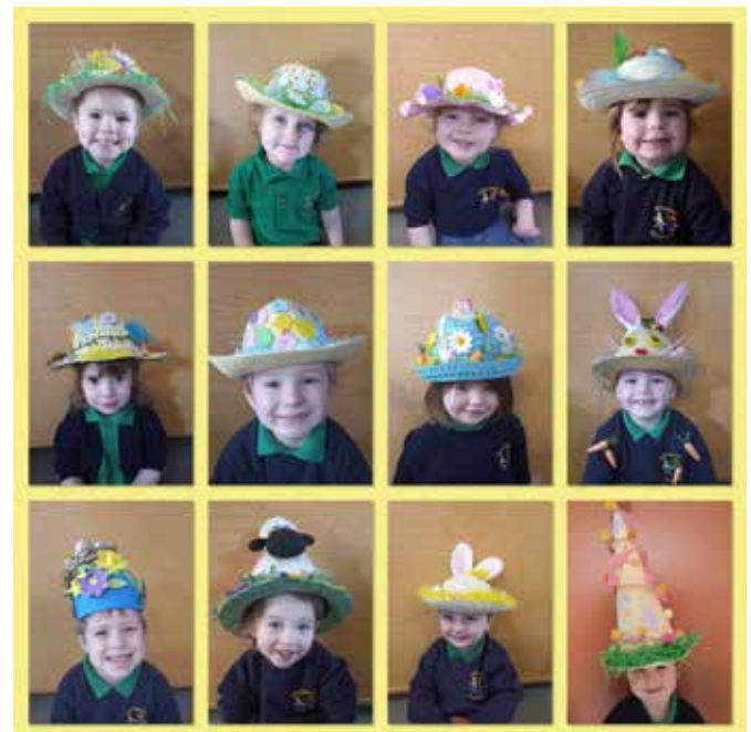
Plant bach y Cylch yn edrych yn bert iawn yn eu hetiau Pasg lliwgar.