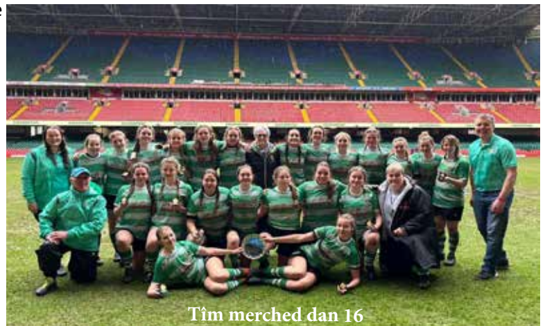
Tîm merched dan 16