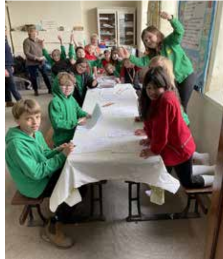
Clwb Hwyl y plant