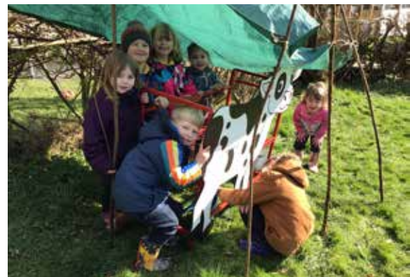
Dyma rhai o ddisgyblion Meithrin wedi creu cartref i'r fuwch a'i godro

Ar ddiwrnod olaf y tymor aeth disgyblion Cyfnod Allweddol 2 i Barc Bywyd Gwylt Cilgerran i ddarganfod mwy am drysorau byd natur. Aethon ar daith gwyllo adar ar hyd y llwybrau cerdded yn ogystal a'r cuddfanau gwyllo adar, a gwrando ar gân yr adar gwahanol a welsom. Dysgon am rywogaethau gwahanol a'u cynefinoedd wrth gwblhau helpa trychfilod. Cawsom gyfle i fwynhau yn y parc ac ymweld â'r siop.