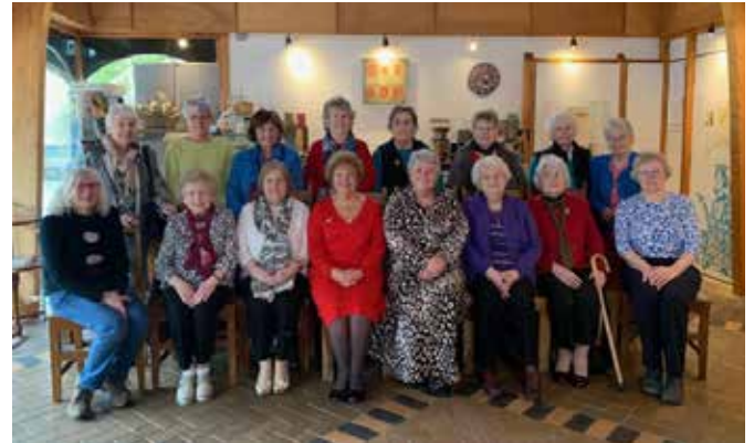
Yr aelodau yn dathlu Gŵyl Dewi